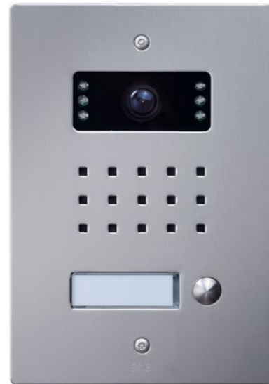
Türstation im eleganten Design (Material V4A Edelstahl geschliffen)