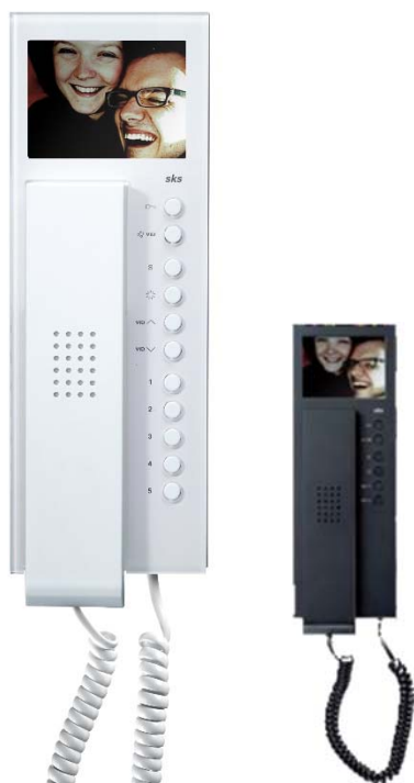
HTV4600 – SKS Video Hörersprechstelle